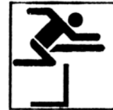
110 m Hürden